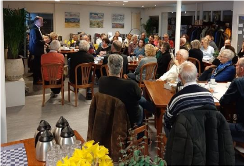
Bewonersavond Gemeente Bergen, begin maart