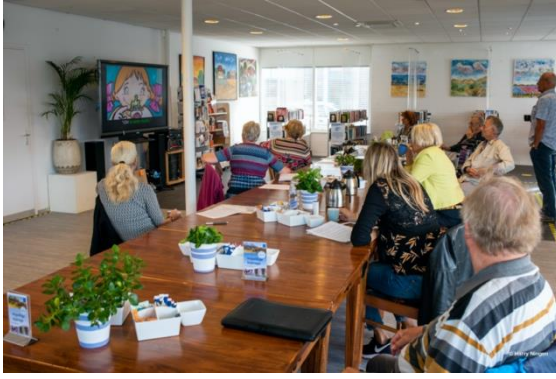
Spaans conversatie druk bezocht