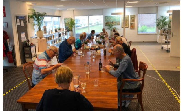
Internationaal koken in kleinere setting