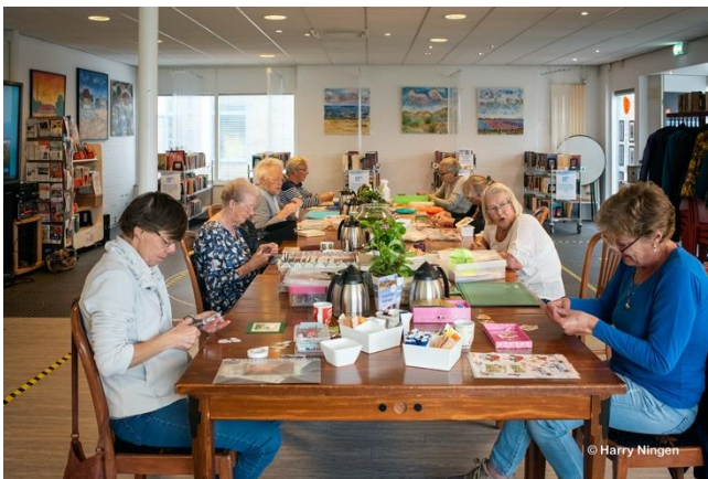
Kaarten maken kon doorgaan