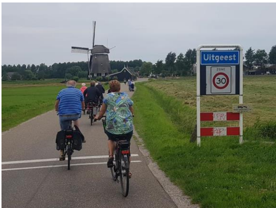
Fietsen ging het hele jaar door