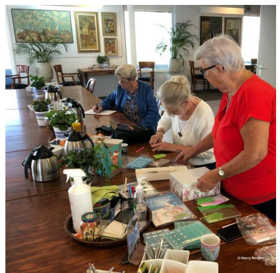
Nieuwe creatieve activiteit op de maandag