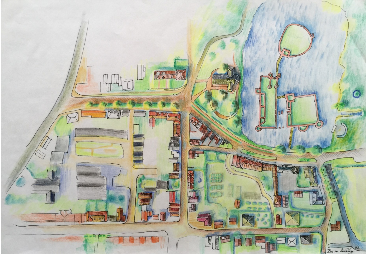
Illustratie © Bas van Nieuwburg