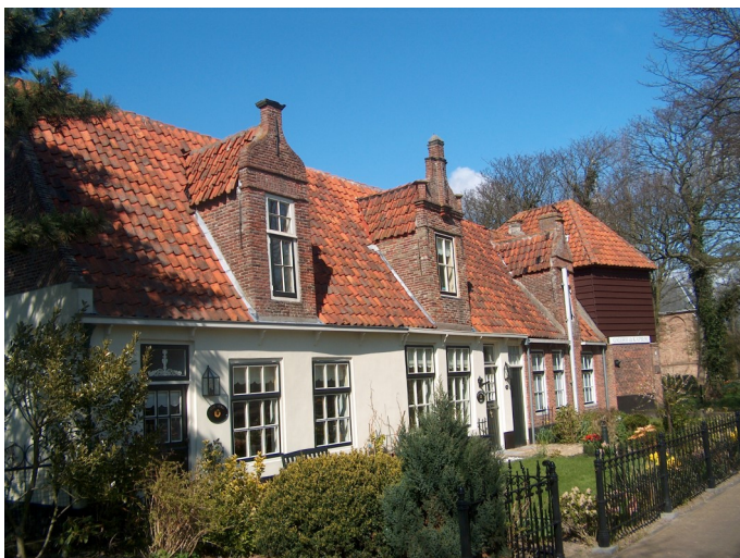
Kanunnikenhuisjes met rechts de Kapberg

Na de gedeeltelijke verwoesting in 1573 volgde in 1633 een restauratie met bijzonder fraaie glas-in-loodramen. In de afgelopen eeuw hebben velen zich ingespannen om de slotkapel te behouden. Ook de omgeving is beeldschoon. Meer over de rijke historie zie slotkapel.nl